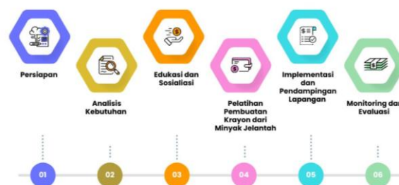
Gambar 1. Tahapan Pelaksanaan Kegiatan

Kegiatan pengabdian kepada masyarakat ini dilaksanakan di Panti Asuhan Aisyiyah Muhammadiyah Kuala Tungkal, Kabupaten Tanjung Jabung Barat, Provinsi Jambi. Program berlangsung selama dua bulan, mencakup tahap persiapan, pelaksanaan, hingga evaluasi akhir. Sasaran kegiatan adalah 30 anak asuh yang terdiri atas yatim, piatu, yatim piatu, dan dhuafa dengan rentang usia 7–17 tahun. Peserta berasal dari latar belakang pendidikan sekolah dasar hingga menengah, sedangkan lokasi utama kegiatan adalah aula panti asuhan yang difasilitasi oleh pengurus lembaga.