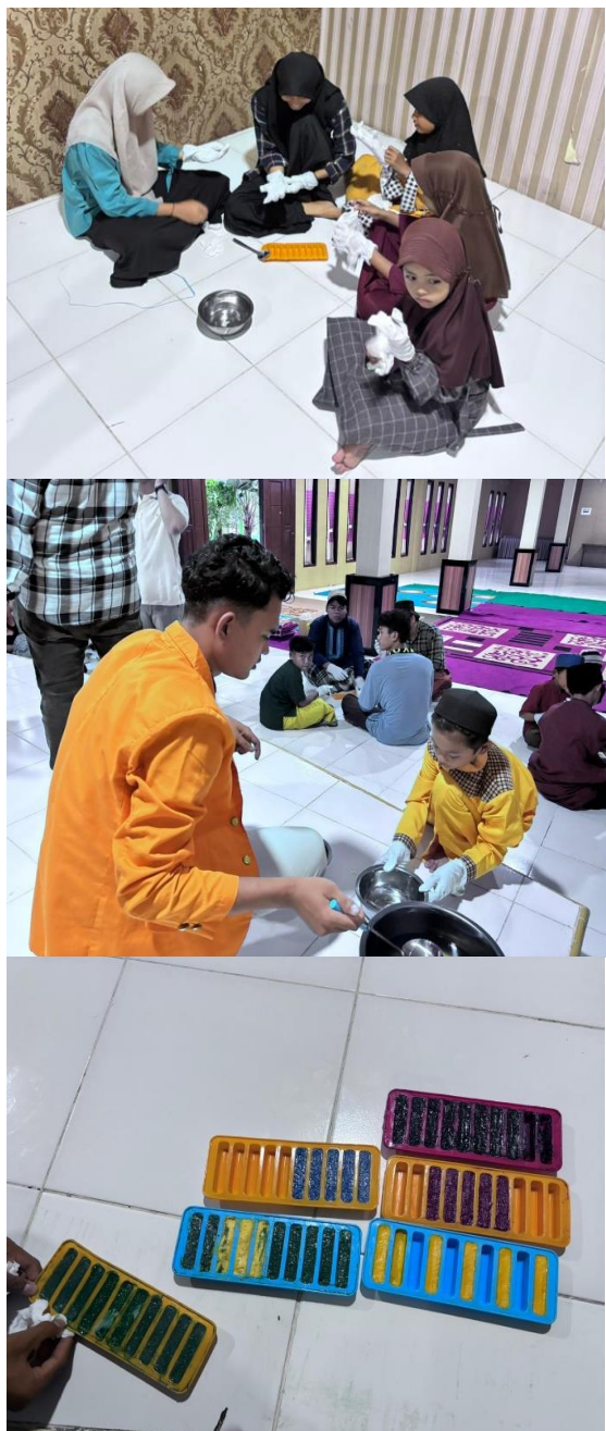
Gambar 3. Praktik membuat krayon

anak dalam mengolah limbah menjadi produk bernilai guna. Kegiatan pengabdian masyarakat yang dilakukan merupakan salah satu upaya untuk meningkatkan pengetahuan peserta. Berbagai bentuk kegiatan dapat dilakukan untuk meningkatkan pengetahuan warga baik melalui pelatihan, sosialisasi ataupun penyuluhan langsung dan tidak langsung [11],[12]