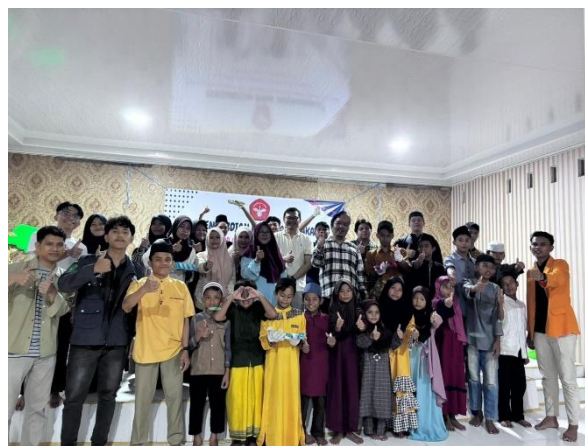
Gambar 5. Foto bersama Tim Pengabdian dan Mitra

Faktor pendorong keberhasilan program antara lain partisipasi aktif anak-anak, semangat belajar yang tinggi, serta ketersediaan bahan baku minyak jelantah yang mudah diperoleh. Disisi lain, memberikan motivasi kepada siswa terkait pelatihan pemanfaatan limbah minyak jelantah untuk membuat sesuatu yang bernilai bagus [15]. Hambatan yang dihadapi terutama adalah keterbatasan peralatan pendukung, seperti jumlah cetakan krayon yang terbatas, sehingga proses produksi dilakukan secara bergantian. Selesai kegiatan ditutup dengan kegiatan foto bersama yang dapat dilihat pada gambar 5.