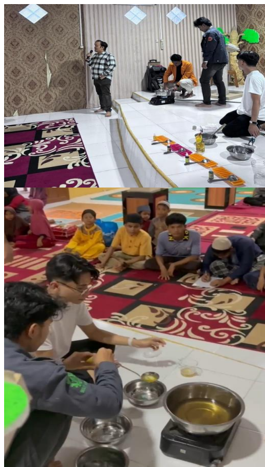
Gambar 2. Tim dosen sedang mendemonstrasikan pembuatan krayon

seperti warna dan bentuk, siswa dapat mengetahui cara yang benar dan siswa lebih yakin untuk mencoba sendiri.